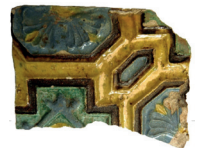
Kafel piecowy XVI w.