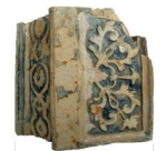
Kafel piecowy poł. XVII w.

Kres rozwojowi zamku położył „potop szwedzki” i wyniszczający pożar z 1657 r. Od wieku XVIII zamek popadał w ruinę. W 1809 r. Austriacy wysadzili prochami Wieżę Zachodnią, grożącą zawaleniem. Malownicze ruiny stały się inspiracją dla kolejnych pokoleń artystów.