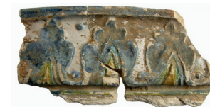
Kafel piecowy 1 poł. XVII w.