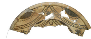
Ceramika naczyniowa, tzw. półmajolika, XVI w.

Na wiek XVI i pocz. XVII - gdy zamkiem władał ród Firlejów - przypadł okres ostatecznej rozbudowy zamku (wyrównano i podwyższono poziom dziedzińca, elewację frontową i wieżę od strony Wisły, w drugiej połowie XVI w. zwieńczono renesansową attyką, dobudowano kolejne pomieszczenia w skrzydle od strony rzeki, powstała reprezentacyjna klatka schodowa).